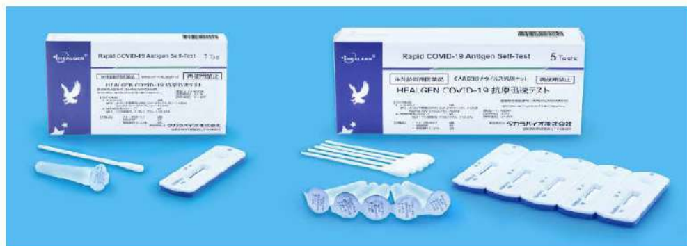
写真(左)1テスト用(右)5テスト用